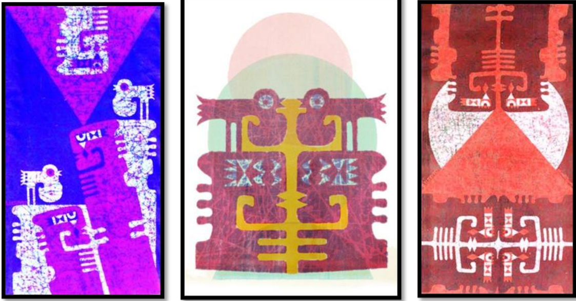
شكل (4-5-6) أعمال الراحل صبري السيد - (تكوين).

فيه لغة الحوار بين لغة التشكيل والمعنى التعبيري دون أن يطغى احدهما على الآخر ، ويؤكد ذلك من التأثيرات السطحية من النعومة والخشونة ، و احياناً تتشكل مساحات متنوعة غنية بالحيوية والحركة وفيها نوعاً من التداخل والتراكب فأهم مايميز لوحاته أنه لم يتخلي أبداً عن جذوره المصرية العريقة ، فربط الحيوية بالتغيير في الشكل واستخدام الأشكال الهندسية بشكل مباشر يفرض بها نظاماً كاملاً يضيف صبغة خاصة على وجود الطبيعة في أعماله (محمد حمزة : 1999) ، يجمع من خلالها بين عدة أساليب فنية من التراكب والتداخل والترديد ؛ ليصل للعمق الفلسفي من خلالها والتأكيد عليه .