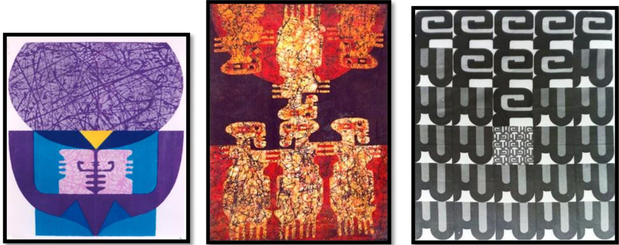
شكل 1-2-3 - أعمال الراحل صبري السيد شكل (1-2-3) - (تكوين).

https://pijad.journals.ekb.eg/article_353296.html?lang=ar