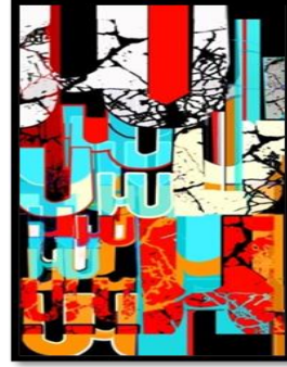
شكل 11 - الفكرة التصميمية رقم (2). المقترح التوظيفي للفكرة التصميمية رقم (2) .