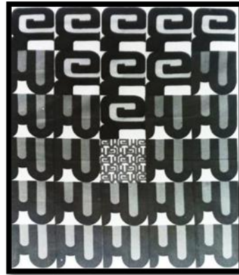
شكل (8-7)- التحليل الفني أحد أعمال الراحل "صبري السيد" تطبيق لتصميم من رسالة الدكتوراه للراحل "صبري السيد" على النسيج باستخدام الشاشات المسطحة - مستخدماً عناصر من الخط الكوفي.