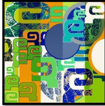
شكل 10 - الفكرة التصميمية رقم (1) المقترح التوظيفي للفكرة التصميمية رقم (1) .