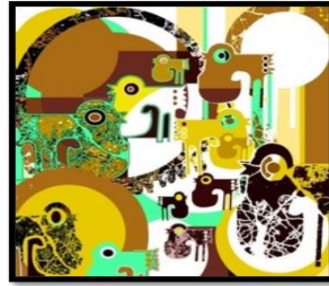
شكل 13- الفكرة التصميمية رقم (3). المقترح التوظيفي للفكرة التصميمية رقم (4).